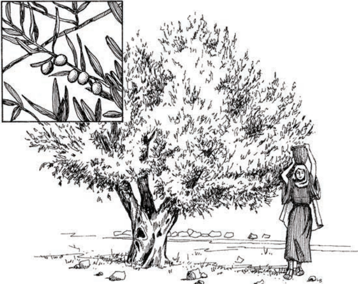
Kēet cī olivi (11:17)

22 Īthōng thīna, had nīa thimatīth kī teedinet cī Nyekuco. Teedinet cī eet cīk ūtūbūrīt ĭnōōnō, ĭthōng thī thimatīth ĭcunni, katī ngī alna nīa thimatītha cīnnī. Ma ngī athii tō, engedothii woccia katī kēnnē nīa buu tuu. 23 Ma da ngī ētērēktaī eeta cīk Īthraīlī ayait lemīnit naboo kūdūt, aku katī ēlēmī Nyekuci ĭnōōgō. Ayak Nyekuci makathīt cī ōbōdanī ĭnōōgō naboo. 24 Ma baalia nīa ma ngī eeni taliibanit cī engedothii tuu kēeta cī ēēn